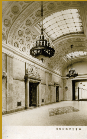
国会議事堂竣工記念ポストカード「議事堂便殿前広場」 田中儀一デザインによる便殿入口レリーフ および床モザイク/昭和11年